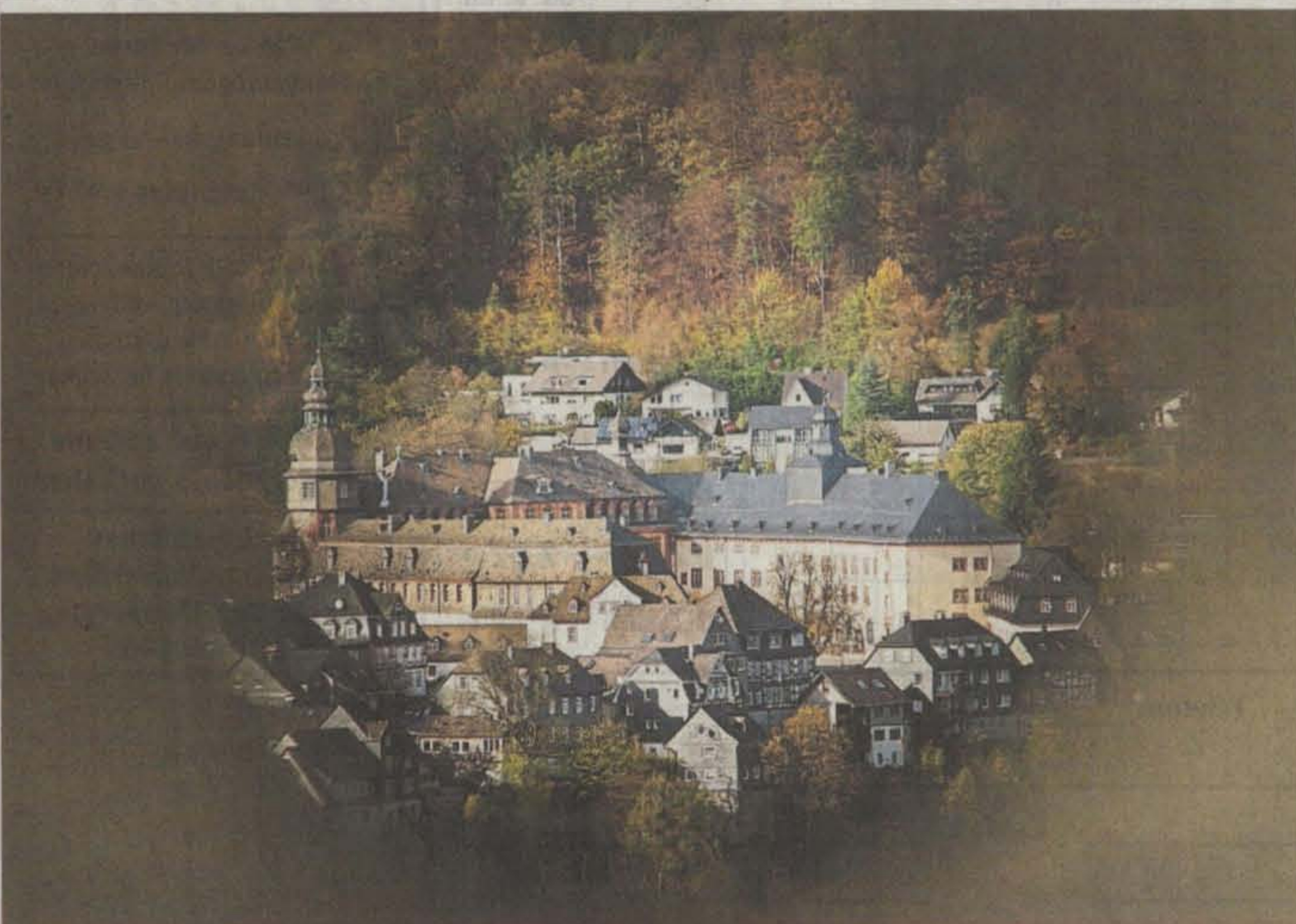
Auch das Schloss Berleburg kann vom Lenneparkplatz gesichtet werden.

Insgesamt sei das Projekt ein das gesamte Stadtgebiet umfassendes organisches Landschafts-Kunstwerk und ausgesprochen identitätsstiftend. Die Standorte der Augensteine: Bad Berleburg: Lenneparkplatz – Blick auf Schloss Berleburg Arfeld: Via Adrina – Blick auf die Ev. Kirche Aue-Wingeshausen: Wisentpfad – Blick auf die Wallburg Aue Diedenshausen: Rotmilan-Höhenweg – Blick auf das Fachwerkhaus „Schreiners“ Elsoff: Rotmilan-Höhenweg – Blick auf die Ev. Kirche Girkhausen: Steinert – Blick auf die Ev. Kirche Raumland: Schieferpfad – Blick auf die Ev. Kirche Schwarzenau: Via Adrina – Blick auf das Herrenhaus